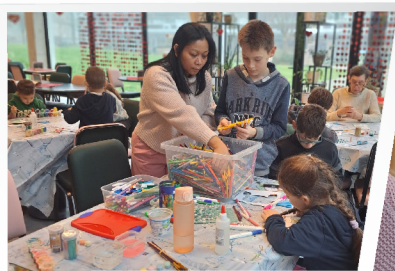
Spel en ontmoeting