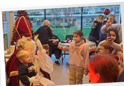
Sint op bezoek