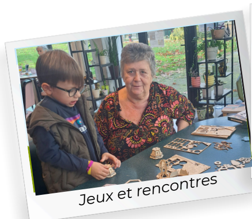
Jeux et rencontres